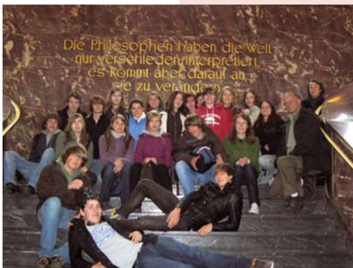
„Die Philosophen haben die Welt nur verschieden interpretiert...“ – 17-Jährige zu Besuch in der Humboldt-Universität zu Berlin – weitere Jugendprojekte siehe Seite 42