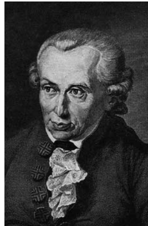
Der deutsche Philosoph Immanuel Kant (1724-1804)