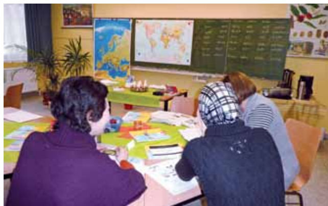
Unterricht in der Ernst-Ludwig-Heim-Grundschule

Sp4.EK922f-11 Simone Lassmann 14.5.-19.6.12, 100 UStd. Mo+Di 9.00-13.05 Uhr Grundschule am Birkenhain, Seeburger Str. 59, Raum 2 € 10,00 TN: 8-12