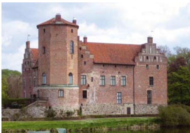
Schloss Turup (Skåne)