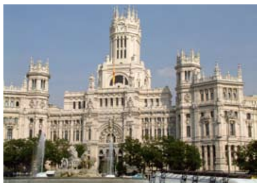
Palacio de Comunicacion Madrid